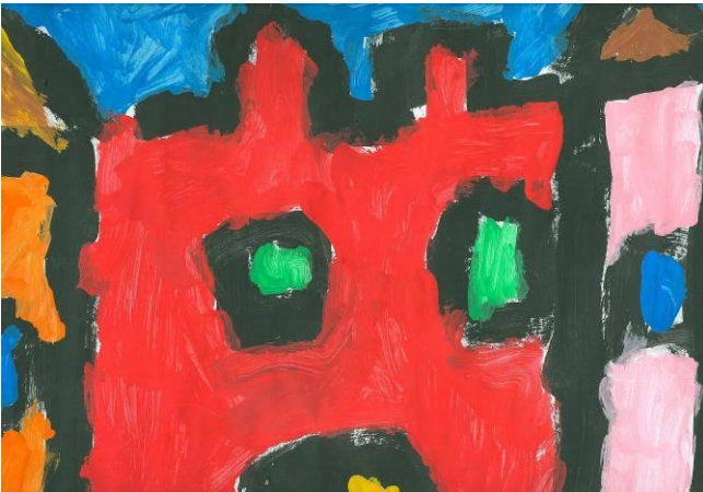
Floor Hoste (2/3 KL B)