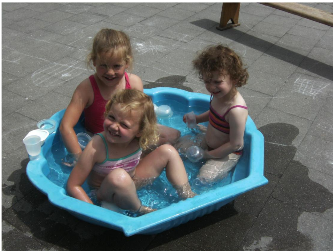
waterplezier in de wijksschool

Omdat psycho-motoriek bij kleuters heel belangrijk is, zullen de kleuterleid(st)ers ook dit jaar bijzondere aandacht besteden aan de 'grote motoriek'. De leid(st)ers van de 1 ste kleuterklasjes in de centrumschool houden elke vrijdagmiddag een fietsuurtje. De kleuters mogen dan hun eigen fietsje meebrengen naar school. In de wijksschool mogen alle kinderen hun fiets meebrengen vanaf 1 september tot aan de herfstvakantie en vanaf de paasvakantie tot het einde van het schooljaar. Bij mooi weer wordt er dan gefietst.